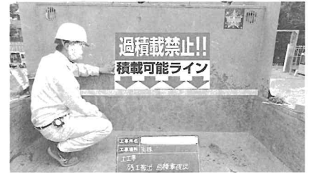
マグネット表示板による積載ラインの表示例