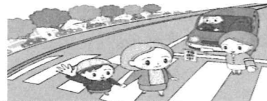
信号機のない横断歩道での一時停止率 8年連続日本一！！